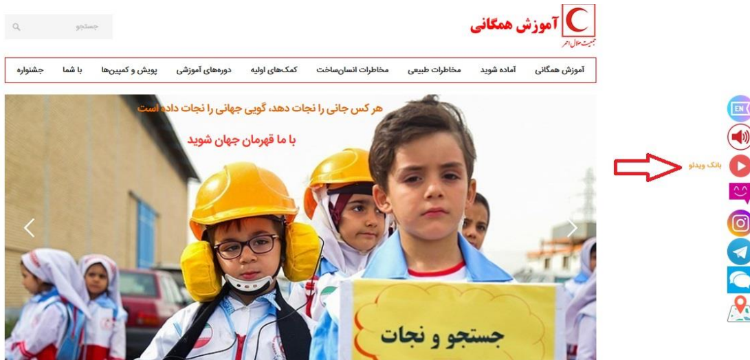
تصویر شماره ۲

توجه: در صورت نیاز به اطلاعات بیشتر، فیلم‌های کمک‌آموزشی مرتبط با سرفصل‌های دوره از دو روش زیر قابل دسترس است. ۱. آیکون بانک ویدئو در سایت آموزش همگانی: کارکنان طبق تصویر شماره ۲ بانک فیلم‌های کمک‌آموزشی را کلیک نمایند.