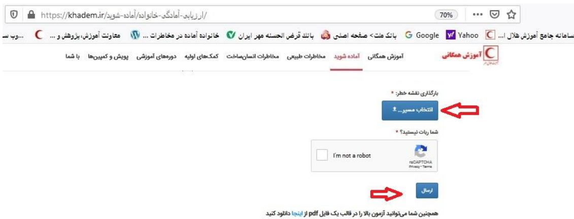
تصویر شماره ۶

۲. ترسیم نقشه خطر: کارکنان بعد از ثبت مشخصات فردی در مرحله ۱ می‌توانند طبق تصویر شماره ۶ نسبت به بارگذاری و آپلود فایل نقشه خطر محل سکونت و یا کار خود در قالب فایل با فرمت‌های PPTX - DOCX - PDF - JPG اقدام نمایند. و برای این‌که مشخص گردد آیا ربات هستند یا خیر، گزینه من ربات نیستم را تیک بزنند و فایل نقشه خطر خود را ارسال نمایند.